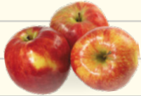
6 manzanas, peladas y picadas