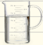
1/2 taza de agua