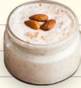
½ taza de yogur de almendra (busque el contenido de azúcar más bajo)