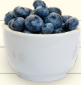
1 taza de arándanos (moras azules)