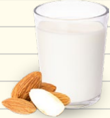
1 taza de leche de almendras