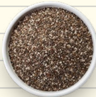
2 cucharadas de semillas de chía