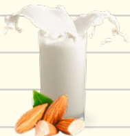
1 taza de leche de almendras