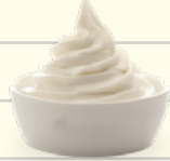
½ taza de yogur de almendra (busque la opción más baja de azúcar)