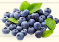
1 taza de arándanos (blueberries)